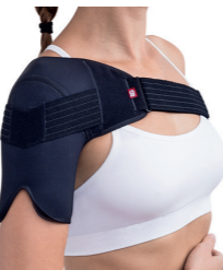
BrownGuard 2000 bandáž ramenní typ 01 (PO2) Doplatek pro pacienta: 191,00 Úhrada ZP: 487,20 oboustranná Kód SÚKL: 5016941