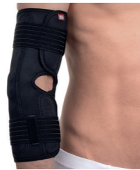
BrownGuard 2000 ortéza loketní typ 01 (PO2) Doplatek pro pacienta: 210,00 Úhrada ZP: 779,52 oboustranná, dvouúsy kloub, tahy Kód SÚKL: 5018480