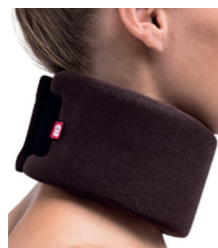
BrownGuard 100 límeč krční typ 02 (PO3) Doplatek pro pacienta: 64,00 Úhrada ZP: 194,88 Kód SÚKL: 5016939