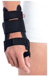
BrownGuard 2000 ortéza zápěstí s fixací palce typ 03 (PO3) Doplatek pro pacienta: 359,00 Úhrada ZP: 340,48 pravá - Kód SÚKL: 5019014 levá - Kód SÚKL: 5019015