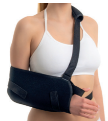
BrownGuard 100 závěs fixační typ 03 (PO2) Doplatek pro pacienta: 82,00 Úhrada ZP: 487,20 oboustranný, fixační páska Kód SÚKL: 5018757