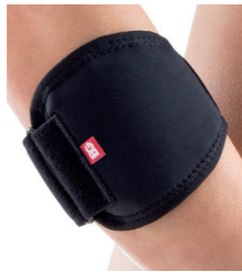
BrownGuard 2000 páska epikondylární typ 01 (PO4) Doplatek pro pacienta: 244,00 Úhrada ZP: 175,84 oboustranná Kód SÚKL: 5016427