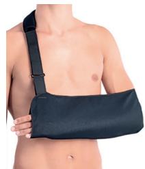
BrownGuard 100 závěs fixační typ 01 (PO2) Doplatek pro pacienta: 67,00 Úhrada ZP: 263,20 oboustranný Kód SÚKL: 5019013