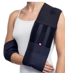
BrownGuard 100 závěs fixační typ 02 (PO2) Doplatek pro pacienta: 0,00 Úhrada ZP: 487,20 oboustranný Kód SÚKL: 5017733