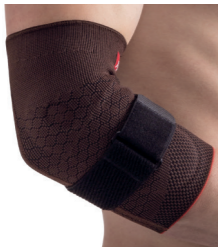
Avicenum ORTHO 1500 bandáž loketní typ 01 (PO4) Doplatek pro pacienta: 410,00 Úhrada ZP: 389,76 oboustranná Kód SÚKL: 5012000