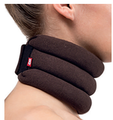
BrownGuard 100 límeč krční typ 01 (PO3) Doplatek pro pacienta: 64,00 Úhrada ZP: 194,88 Kód SÚKL: 5017825